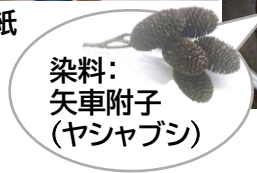
染料: 矢車附子 (ヤシャブシ)