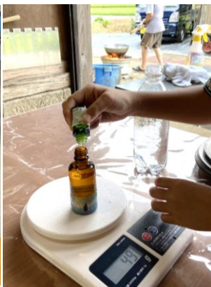
アテの虫よけスプレー