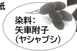
染料: 矢車附子 (ヤシャブシ)