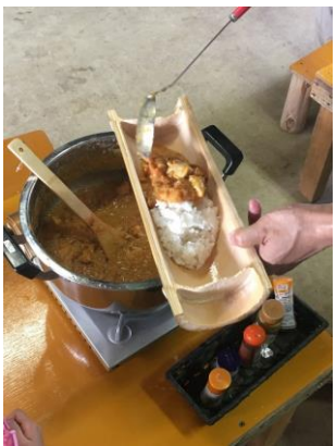
竹筒ごはん と 薬草カレー